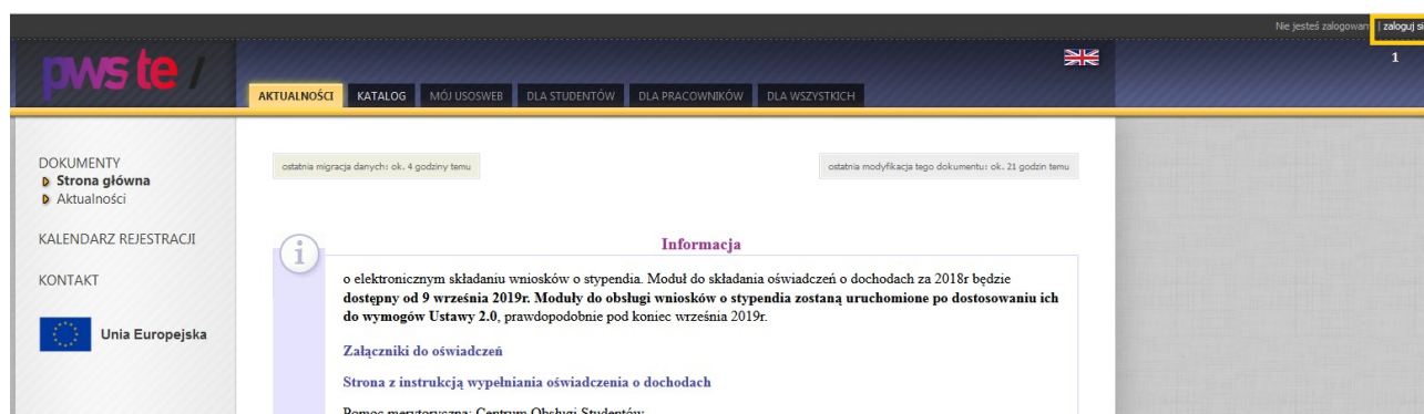
Rys. 1: USOSweb - strona główna serwisu

Po kliknięciu w powyższy załącznik zostaniesz przeniesiony do strony głównej portalu USOSweb PWSTE (Rys. 1). Następnie w prawym górnym rogu klikamy na przycisk Zaloguj się (Rys. 1 pkt 1)